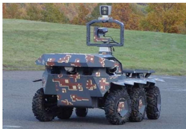
UGV TAROS 6X6